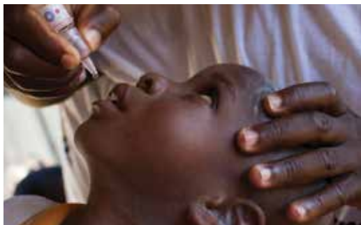
En rotarian ger poliovaccin till ett barn i Nigeria i Afrika

Våra medlemmars och andra personers bidrag till Foundation gör det möjligt för oss att bringa hållbar förändring till behövande samhällen. Fråga ordföranden i din klubbs Rotary Foundation-kommitté eller gå till rotary.org/donate för att ta reda på hur du kan stödja vår Foundation. För mer information, ladda ner The Rotary Foundation Reference Guide eller ta kursen Rotary Foundation Basics i Rotarys Learning Center .