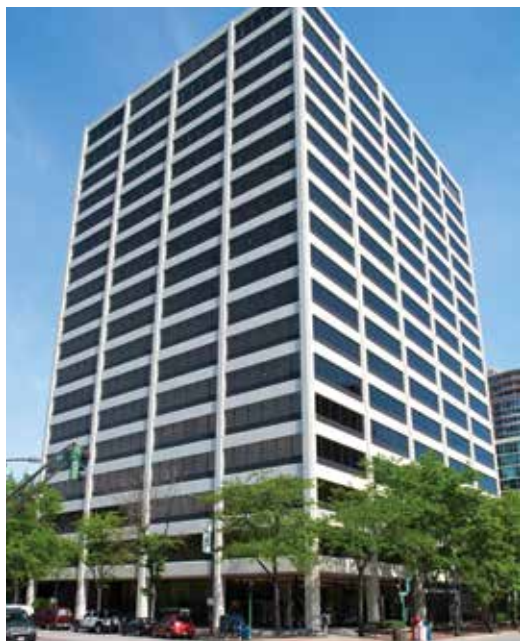
One Rotary Center i Evanston, Illinois, USA

Rotary International styrs av sekretariatet, som består av generalsekreteraren och nästan 800 anställda som arbetar för att ge stöd till klubbar och distrikt i hela världen. Rotarys huvudkontor ligger i Evanston, Illinois, USA, i en byggnad som heter One Rotary Center. I den här byggnaden finns ett auditorium med 190 sittplatser, Rotarys arkiv och en svit med konferensrum för RI-styrelsen och Rotary Foundation-styrelsen samt kontor för RI-presidenten och andra högt uppsatta funktionärer. Här finns även en exakt kopia av rum 711, där