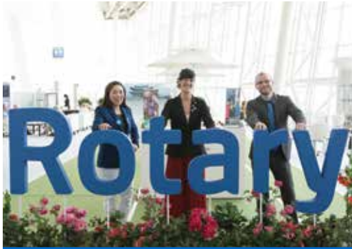
Deltagare vid 2016 års Rotary International Convention i Korea