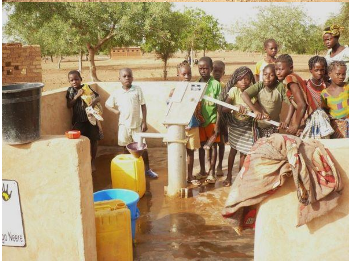
Le puits en exploitation