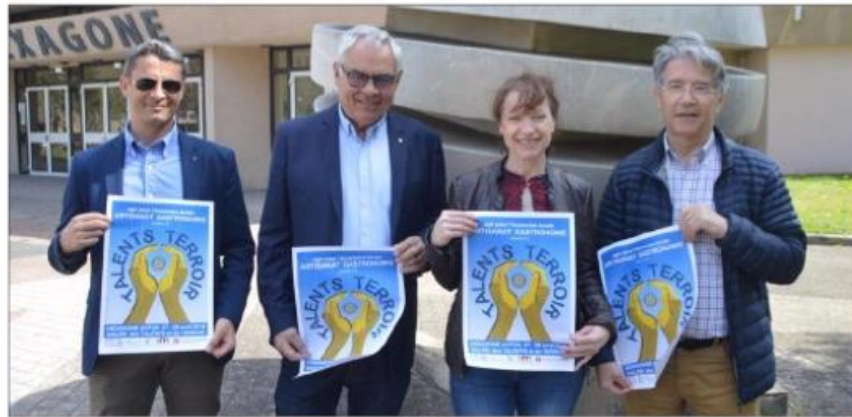
Le bureau du Rotary a présenté le programme de son salon, qui est organisé à l'Hexagone.

Ainsi est né "Talents et Terroirs", que le Rotary club d'Autun organise les 27 et 28 avril à l'Hexagone. Un salon conçu pour promouvoir l'économie locale, qui accueillera une trentaine d'artisans et artistes locaux reconnus pour leur savoir-faire