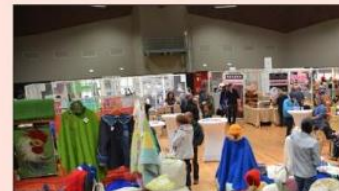
Près de 700 visiteurs sont venus découvrir les créations des artisans locaux qui exposaient tout le week-end à l'Hexagone.

700 visiteurs sur deux journées, 37 exposants et le tout dans une ambiance conviviale et chaleureuse : le premier salon Terroirs et Talents, organisé par le Rotary club d'Autun, a rencontré un franc succès. « Nous sommes très satisfaits, nous avons eu du monde tout le week-end et l'ensemble du public (visiteurs comme exposants) est enchanté. Le bilan est positif en partie aussi grâce aux nombreux annonceurs que nous remercions. Pour un événement initié en janvier, c'est une réussite ! » Une action qui sera probablement pérennisée avec une nocturne.